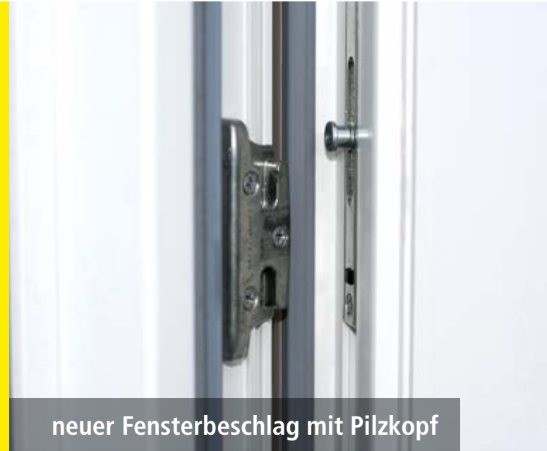
neuer Fensterbeschlag mit Pilzkopf