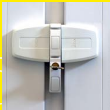
Fenstersicherung für zweiflügelige Fenster