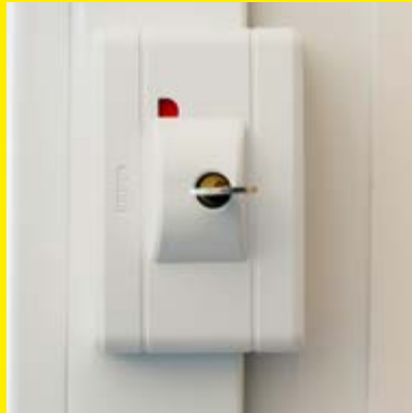
Fenstersicherung am Fensterrahmen