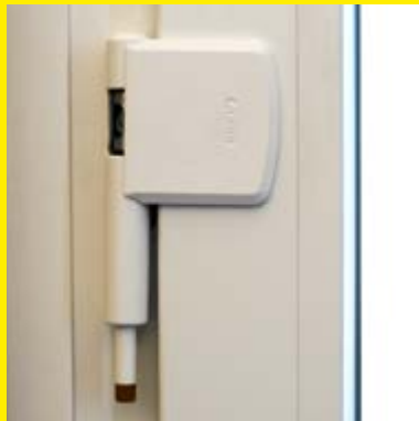
Fenstersicherung an der Scharnierseite